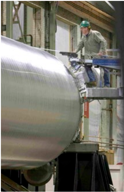
空气产品公司生产各种绕管式换热器的绕管工艺。