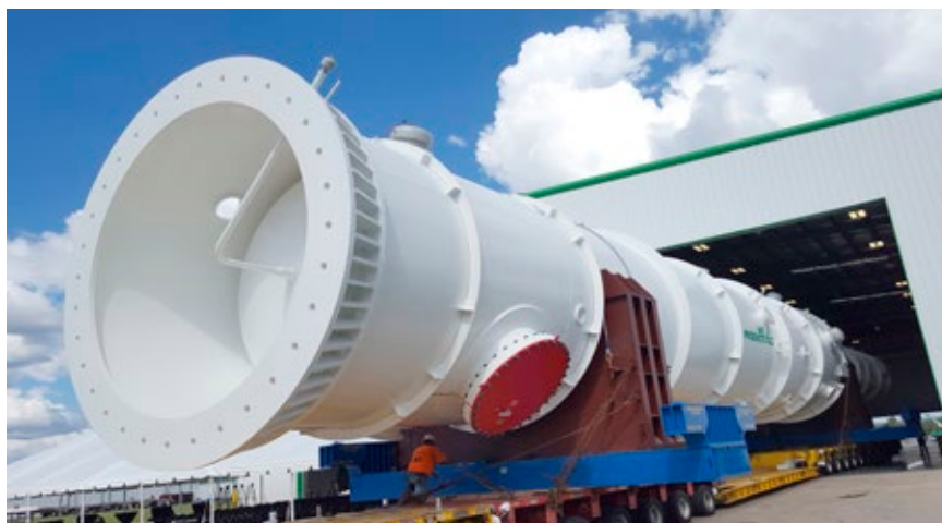
空气产品公司定制设计的大型绕管式换热器。

对于AP-X®液化天然气工艺，除液化工艺设计和绕管式换热器（CWHE）外，空气产品公司还设计和生产低温氮气增压膨胀机（增压透平膨胀机）和氮气节能换热器冷箱。